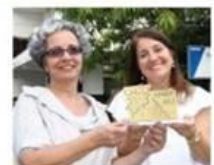
Direção da ETE comemora a conquista do troféu da 7ª Obmep

Destaque para a ETE Henrique Lage, localizada no Barreto. Foram 25 Menções Honoras para os estudantes. Resultado que colocou a escola entre as cinco no Estado que mais tiveram participantes premiados, e por isso foi uma das cinco escolas